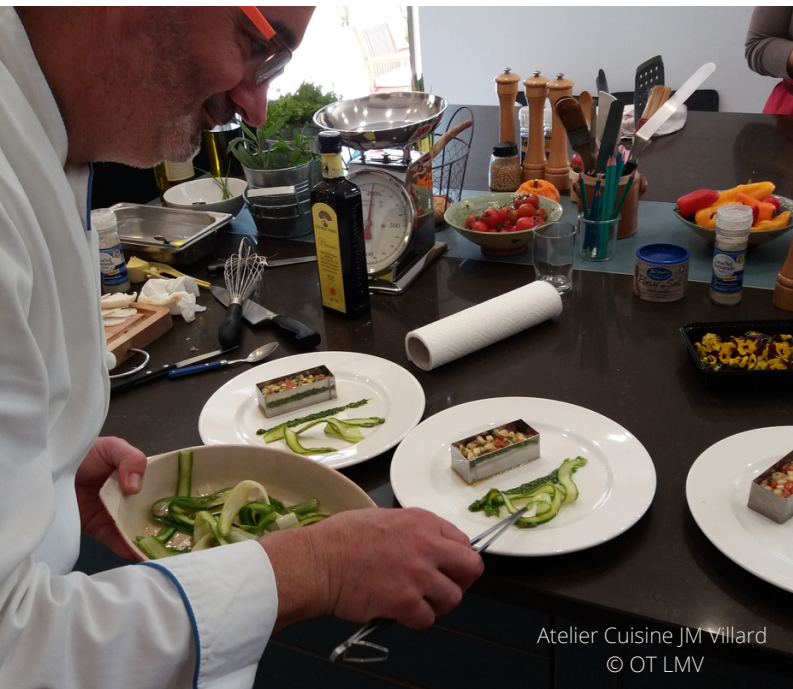
Atelier Cuisine JM Villard

In een praatje met een ambachtsman/vrouw ontdek je waar hij/zij inspiratie vindt in de Luberon en kom je alles te weten over zijn/haar kunst.