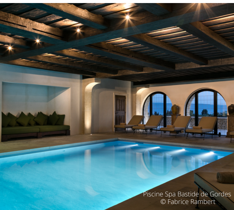
Piscine Spa Bastide de Gordes