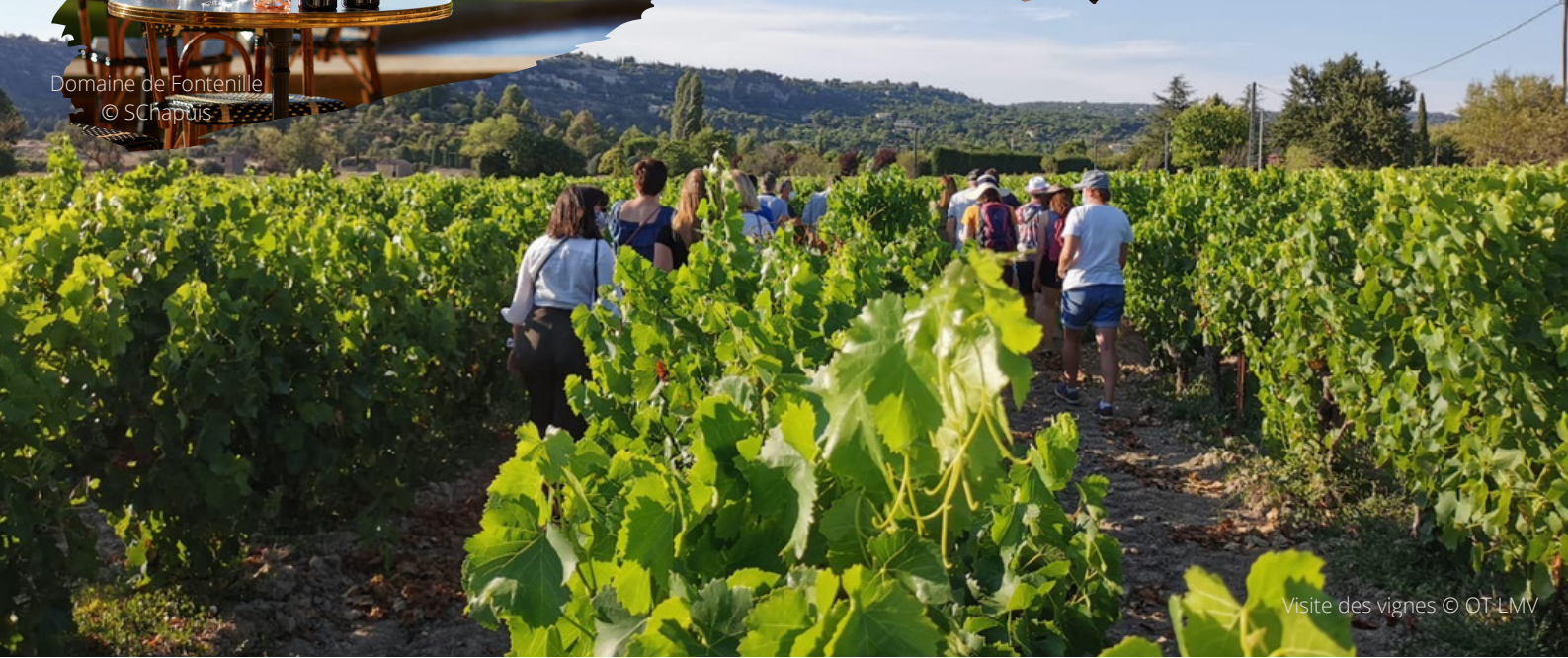
Visite des vignes