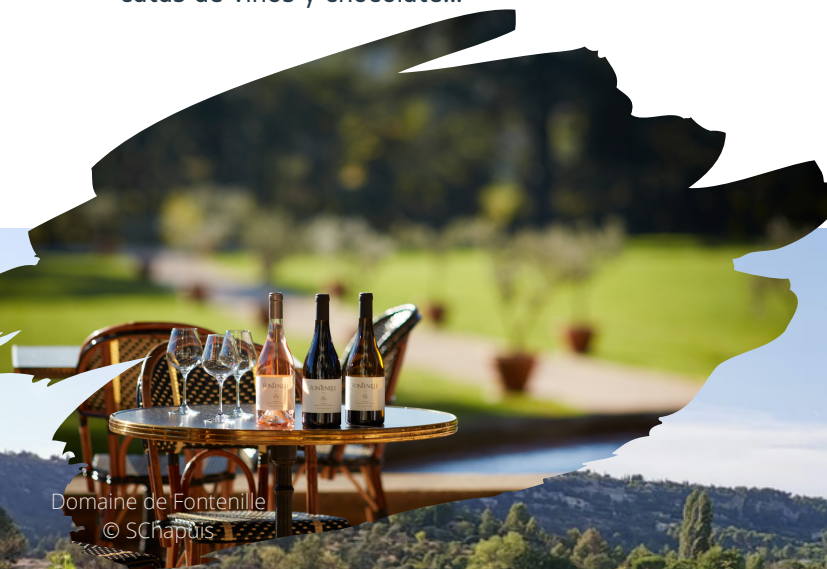
Domaine de Fontenille

Los encuentros y degustaciones en las bodegas suelen ir acompañados de momentos mágicos tal como cenas, conciertos o talleres temáticos.