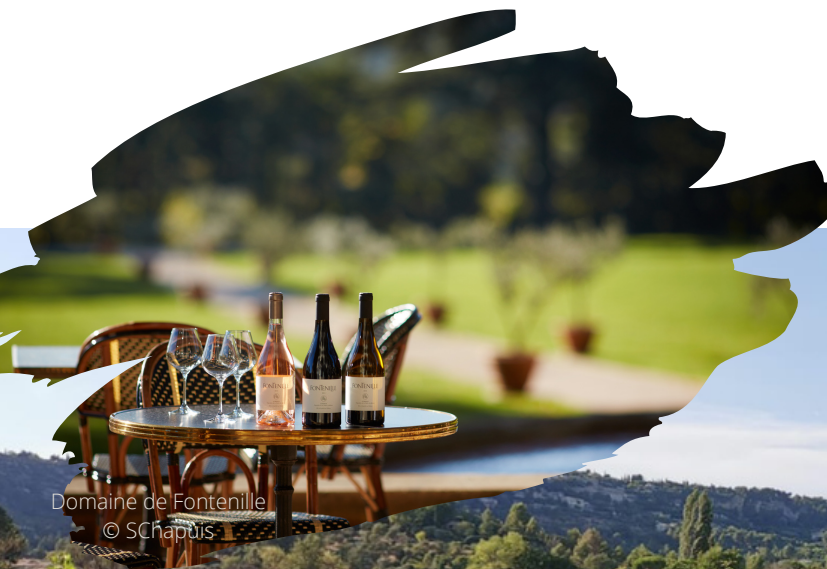
Domaine de Fontenille

Una volta sul posto, cinque sentieri tra le vigne con una percorrenza che varia dai 20 minuti ad 1 ora e mezza vi permettono di immergervi più a lungo in questo mondo del vino.