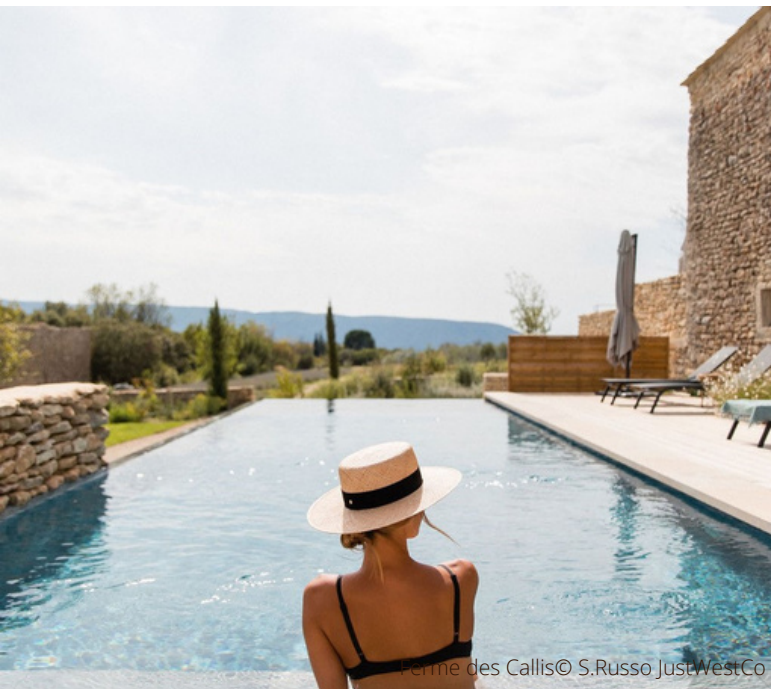
Perme des Callis