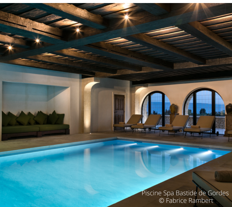
Piscine Spa Bastide de Gordes

Hotel, concept stores e gallerie d'arte. Alcuni albergatori hanno fatto la scelta di un'architettura e di una decorazione decisamente contemporanea nel cuore della Provenza. Una maniera di viaggiare di totale immersione nell'ambiente della Provenza con soluzioni informali, chic e attuale.