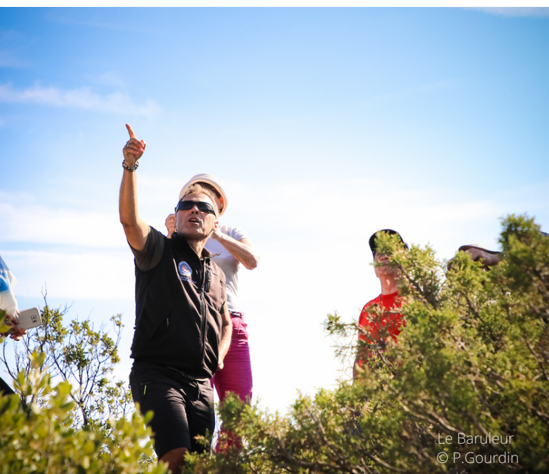
Le Baruleur