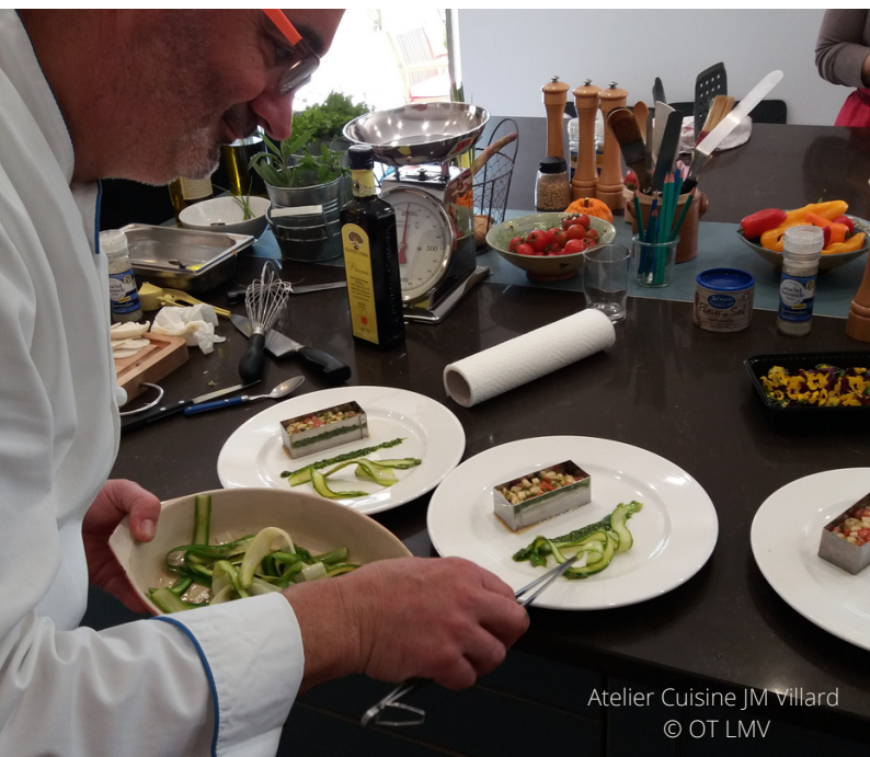
Atelier Cuisine JM Villard