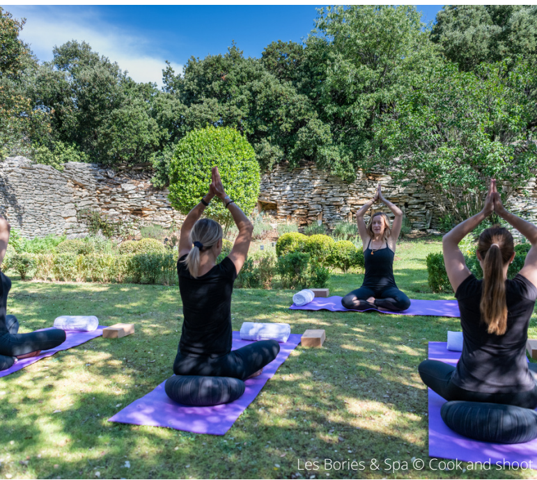
Les Bories & Spa

Oltre ai tanti i piccoli villaggi presenti sul nostro territorio e che bisogna assolutamente visitare per vivere al ritmo della Provenza. Alcuni vi offrono l'opportunità in più di andare in giro scoprire diversi negozi affascinanti e numerosi caffè o sale da thé per completare la vostra visita nel giorno del mercato o in qualsiasi altro giorno della settimana. Da non perdere.