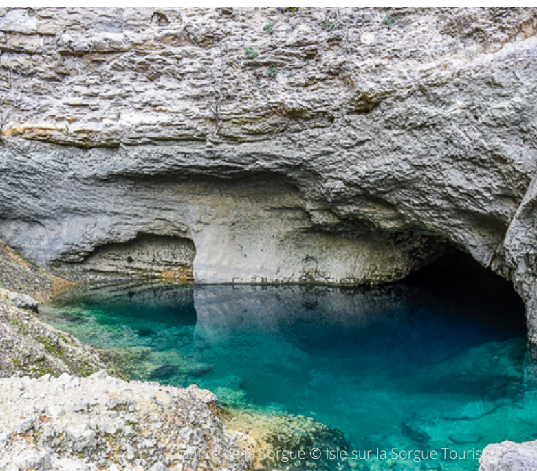
Fontaine de la Sorgue © Isle sur la Sorgue Tourisme