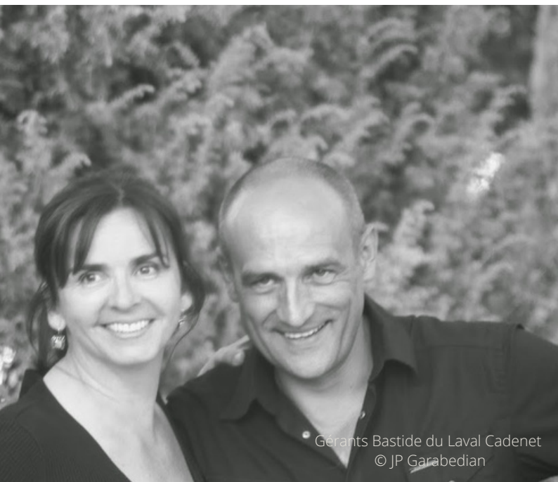
Gérants Bastide du Laval Cadenet

Fare parlare un artigiano artistico che dà voce alla materia prima e la lavora traendo ispirazione dal territorio del Luberon.