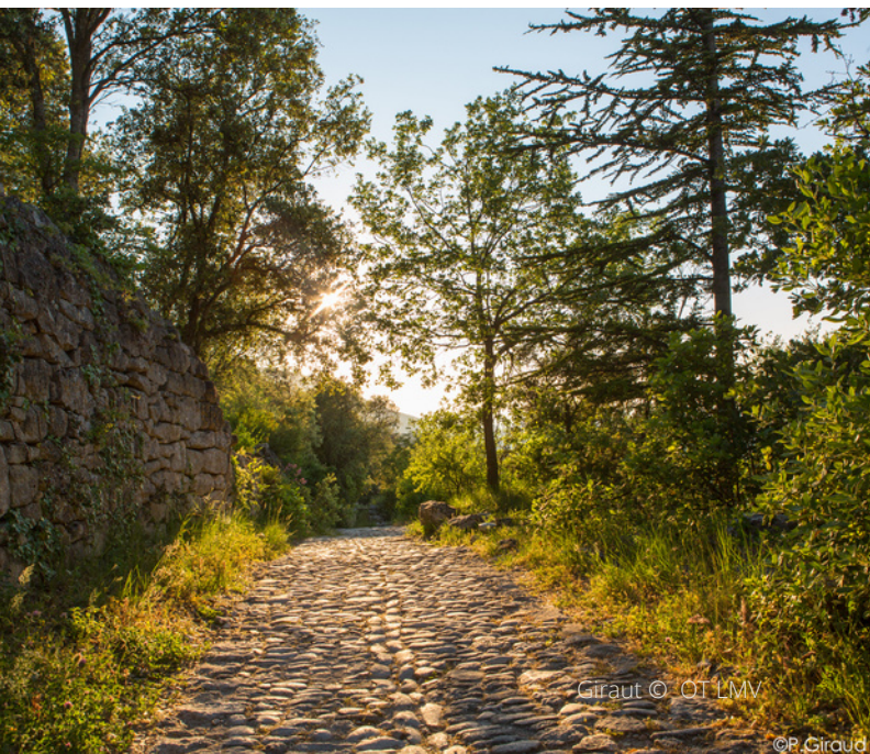
Giraut © OT LMV