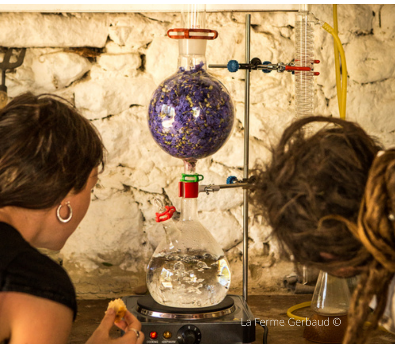
La Ferme Gerbaud ©