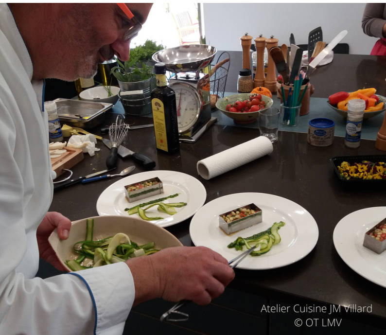
Atelier Cuisine JM Villard