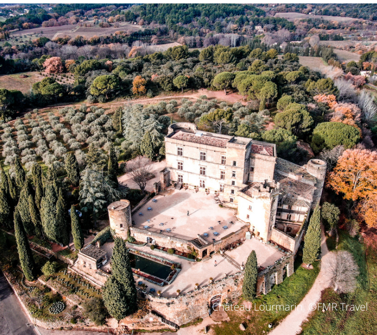
Chateau Lourmarin