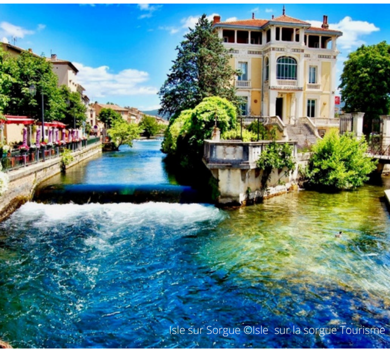
Isle sur Sorgue

뤼베롱에 있는 마을들은 뫼비롱에 걸쳐 있는 산맥인 마시프 뒤 뫼비롱과 보클뤼즈 산의 높은 곳에 기대어 있다는 점이 특징입니다. 당신이 발견한 마을이 어느 마을이든 그곳은 계곡 위에 우뚝 서 있거나 올리브 나무, 포도나무, 혹은 참나무로 둘러싸인 곳일 겁니다. 각각의 뷰 포인트마다 마시프 뒤 뫼비롱에서만 볼 수 있는 풍경이 존재하는데 뫼비롱, 뫼투 산, 몽미라일의 들쭉날쭉한 봉우리들, 알필 산, 그리고 생트 빅투와르 산 등등 남프랑스에서 가장 유명한 전경이 펼쳐진 것을 감상할 수 있습니다.