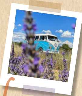
26 Des idées de séjours...