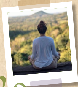
20 Hiver Calme et découvertes