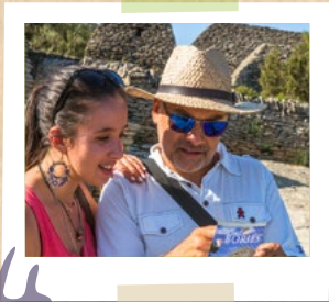
24 Des rencontres Idées d'interviews...