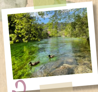
8 Printemps Le renouveau des paysages