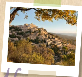
16 Automne L'été indien