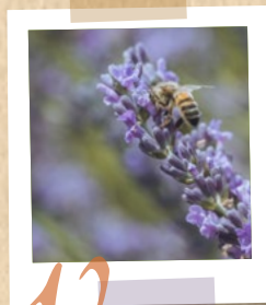
12 Été Un festival de couleurs