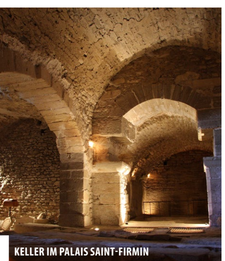
7 KELLER IM PALAIS SAINT-FIRMIN