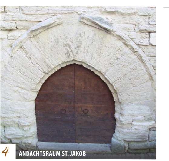
4 ANDACHTSRAUM ST. JAKOB