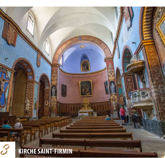
3 KIRCHE SAINT-FIRMIN

Aalmoezieniersverblijf St. Jacques: Verleende vroeger onderdak aan pelgrims die op weg waren naar Santiago de Compostella. De meeste pelgrims reisden echter door de Calavontal op de Via Domitia die Italië met Spanje verbond. Gesloten voor het publiek.