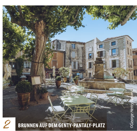
2 BRUNNEN AUF DEM GENTY-PANTALY-PLATZ

Bis 1956 stellte dieser Brunnen die Wasserversorgung des Dorfes sicher. Erst 1957 wurden die Häuser mit Wasserleitungen ausgestattet. Dieses Leitungswasser durfte allerdings nur als Koch- und Trinkwasser verwendet werden und es war verboten, damit Wäsche zu waschen. Das Waschhaus befindet sich im unteren Teil des Dorfes im Viertel „Fontaine Basse“. Der früher in Richtung Westen fast geschlossene Platz bildete das Herzstück des mittelalterlichen Dorfes. Sein Name erinnert an einen Koch aus Gordes, der Anfang des 20. Jhdts. lebte.