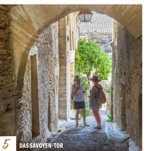
5 DAS SAVOYEN-TOR