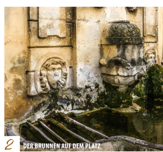
2 DER BRUNNEN AUF DEM PLATZ