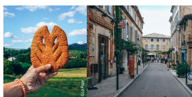
GIBASSIER PLACE DE L'ORMEAU

De combe van Lourmarin: Een opening in het gebergte van de Luberon ten noorden van het dorp Lourmarin verbindt het dal van de Durance met dat van de Cavalon (Apt/Cavaillon). De zogenaamde combe van Lourmarin is een nauwe doorgang die de Luberon van noord naar zuid doorkruist. Beneden stroomt de Aiguebrun. Vooral de Romeinen oefenden vanop de bergen een strenge controle op de combe uit aan de ingang van de bergengte.