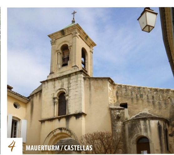
4 MAUERTURM / CASTELLÁS