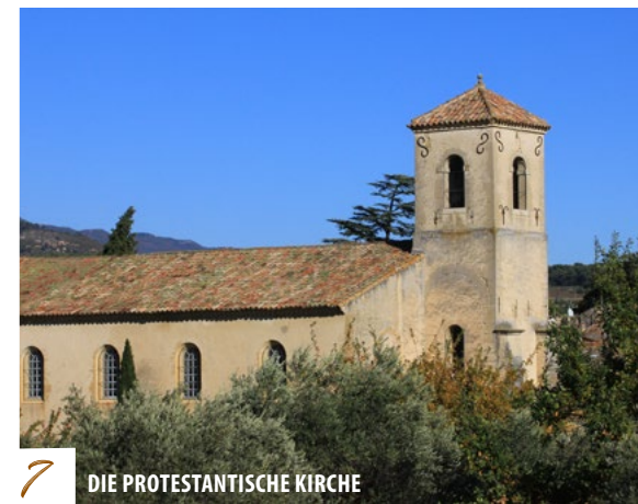
7 DIE PROTESTANTISCHE KIRCHE