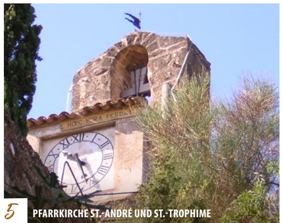
5 PFARRKIRCHE ST.-ANDRÉ UND ST.-TROPHIME