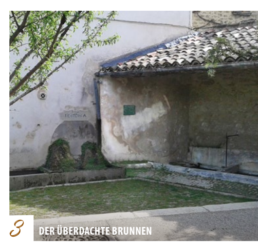
3 DER ÜBERDACHTE BRUNNEN