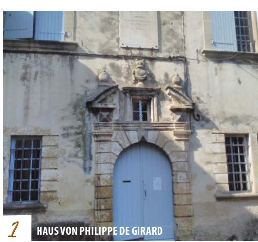
1 HAUS VON PHILIPPE DE GIRARD

— De overdekte fontein: Ze dateert van de zestiende eeuw en werd in 2010 gerestaureerd. Op de fontein staan de initialen van de beeldhouwer gegraveerd. Daarnaast staat een wasplaats die tot het einde van de Tweede Wereldoorlog werd gebruikt. De rivier die erlangs stroomt is de Rayet.