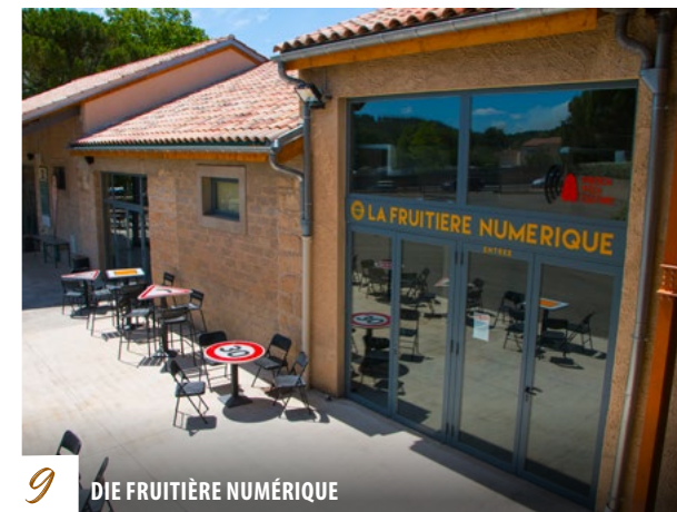
9 DIE FRUITIÈRE NUMÉRIQUE

MARKTTAGE: Wochenmarkt: Freitagvormittag ERZEUGERMARKT: von April bis November, dienstags ab 17 Uhr in La Fruitière Numérique — Markttag: Markt: Vrijdagmorgen Markt van ambachtelijke producenten: Van april tot november, op dinsdag vanaf 17:00 uur bij La Fruitière Numérique.