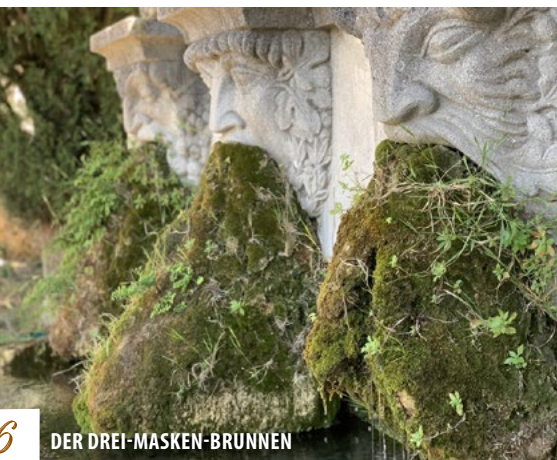
6 DER DREI-MASKEN-BRUNNEN